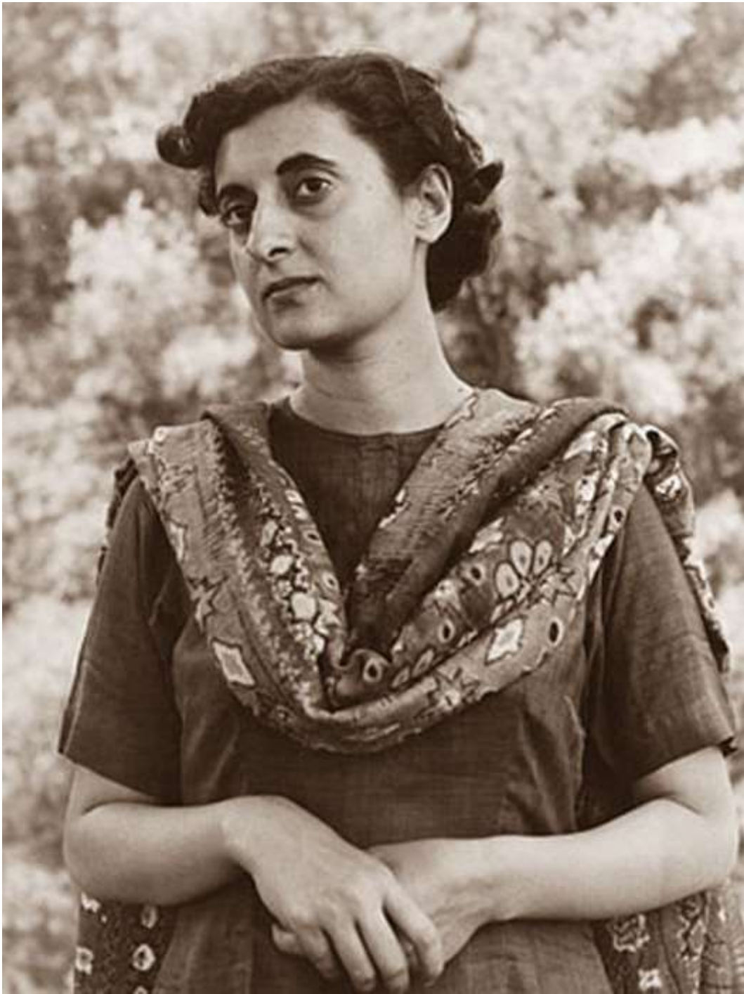
1978 – В Германии выпущен последний автомобиль "фольксваген-жук"