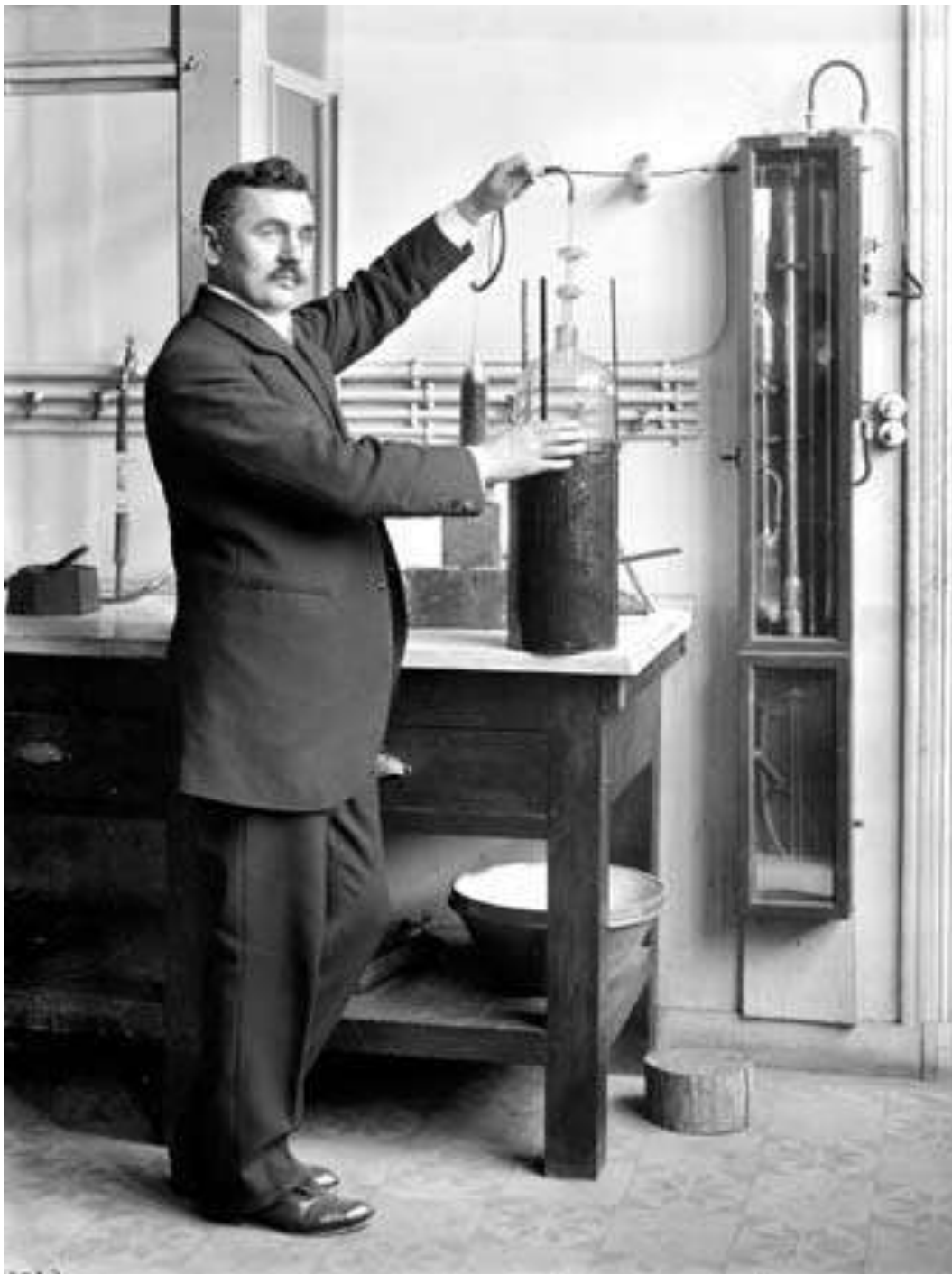
1919 – Композитор Игнацы Падеревский возглавил правительство Польши